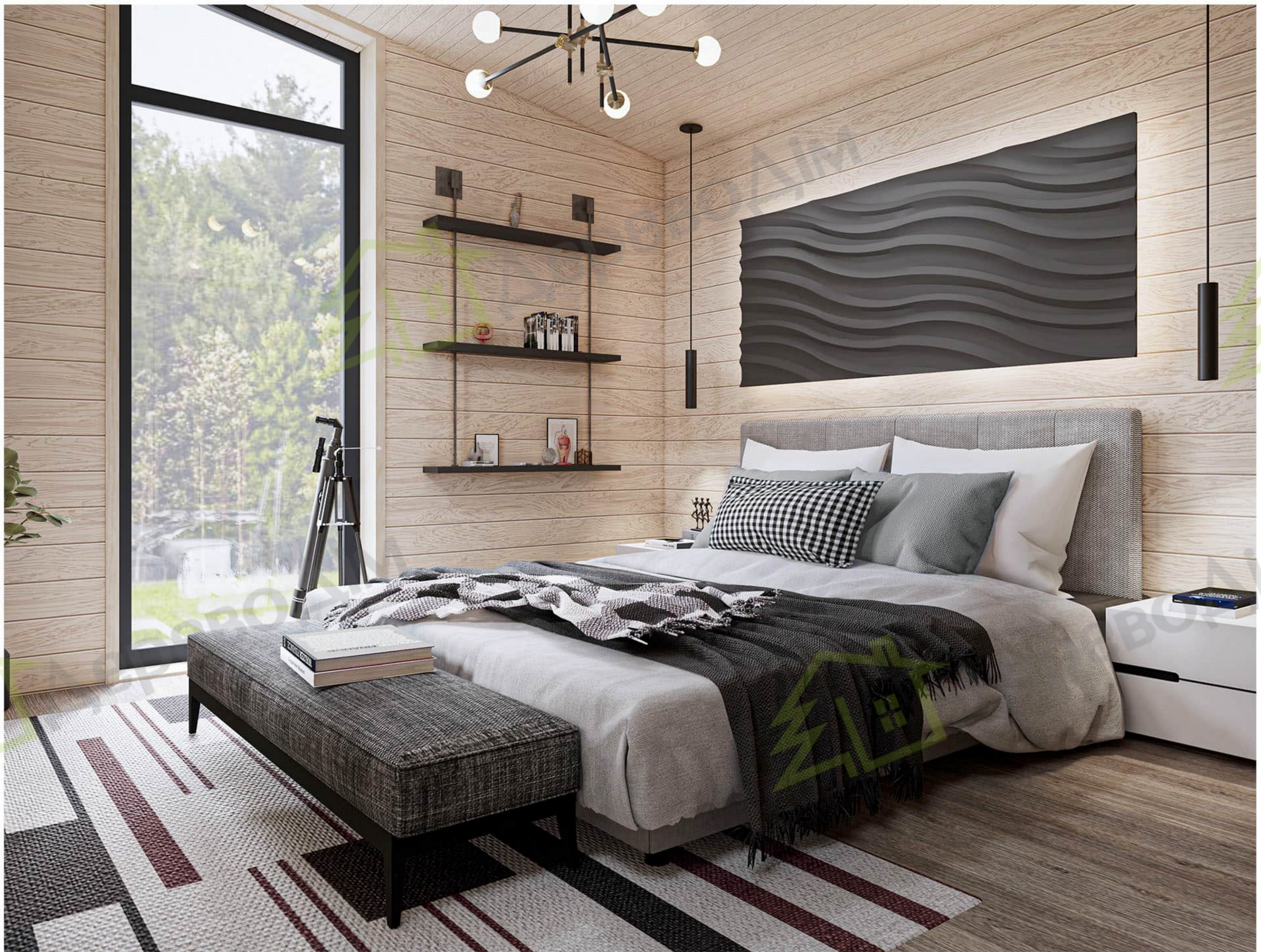
Спальня № 2