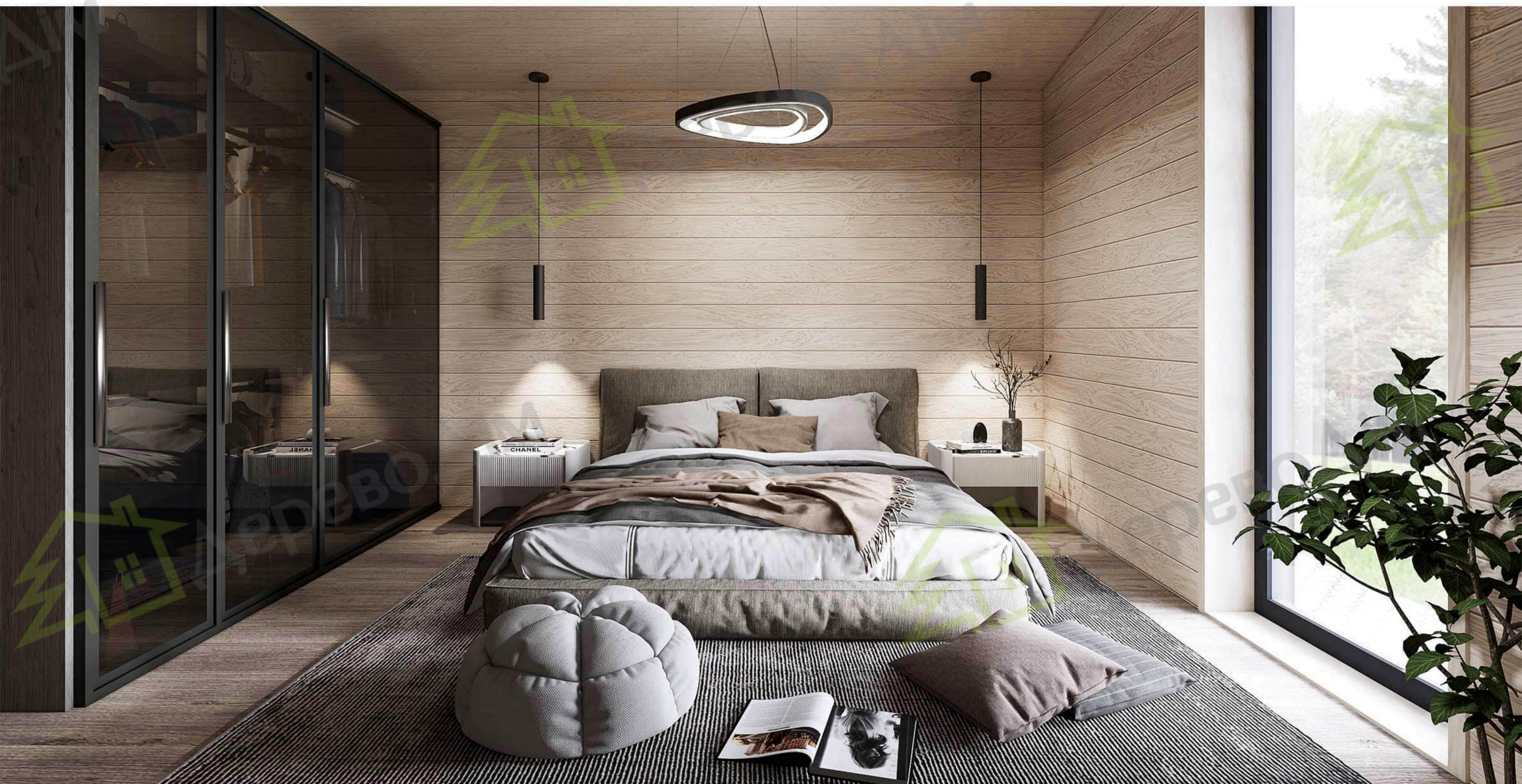
Спальня № 1