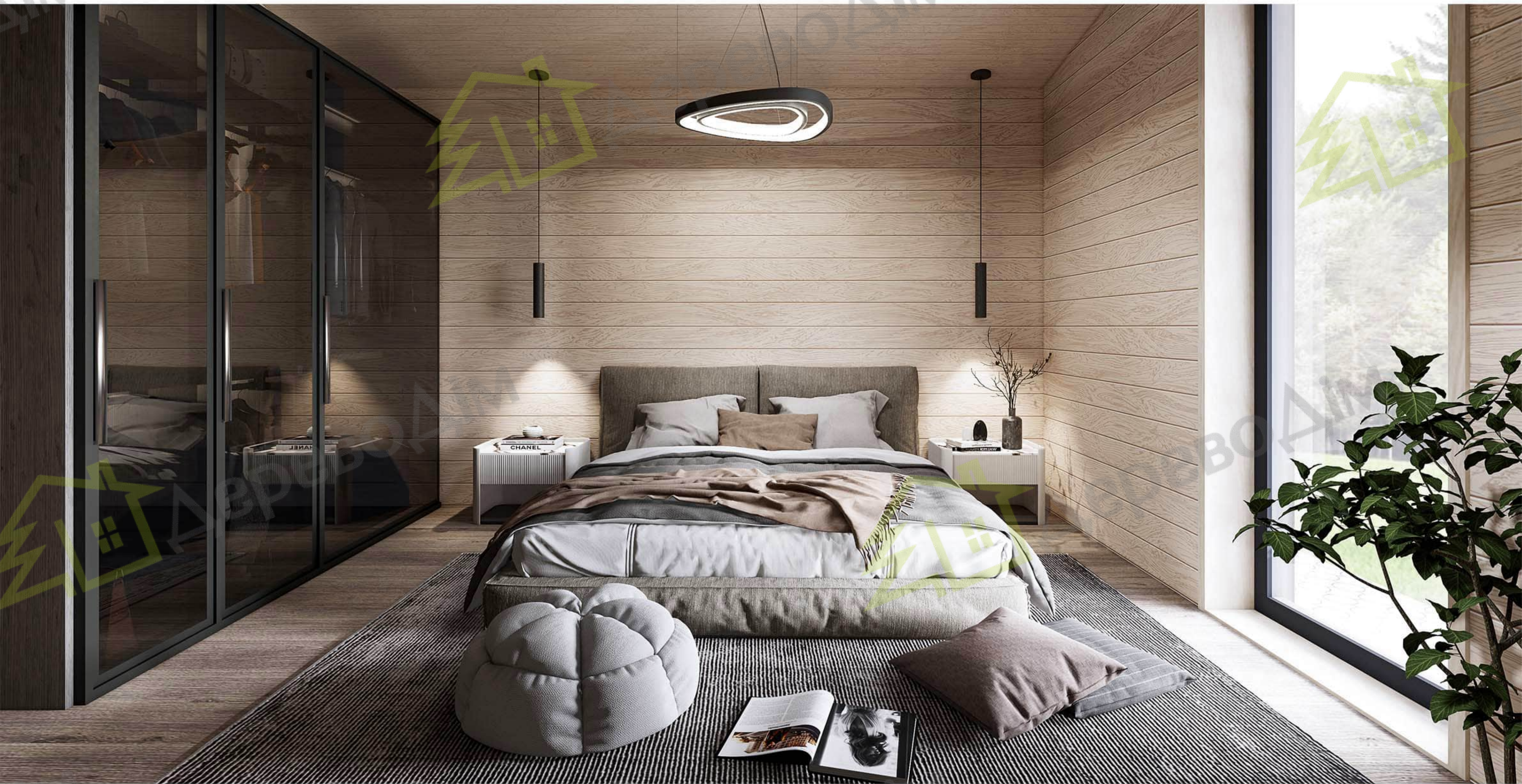
Спальня № 1