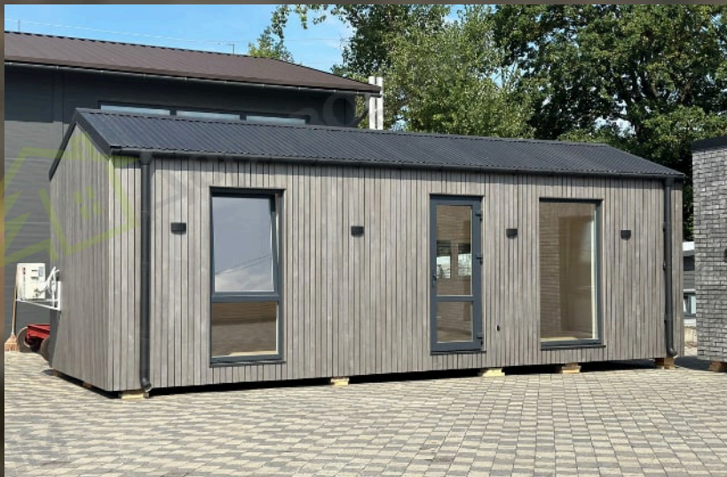
"Тетяна" із двосхилим дахом — обговорюється та прораховується індивідуально.

Відеоогляд будинку з демонстрацією його планування, конструктивних рішень та оздоблення.