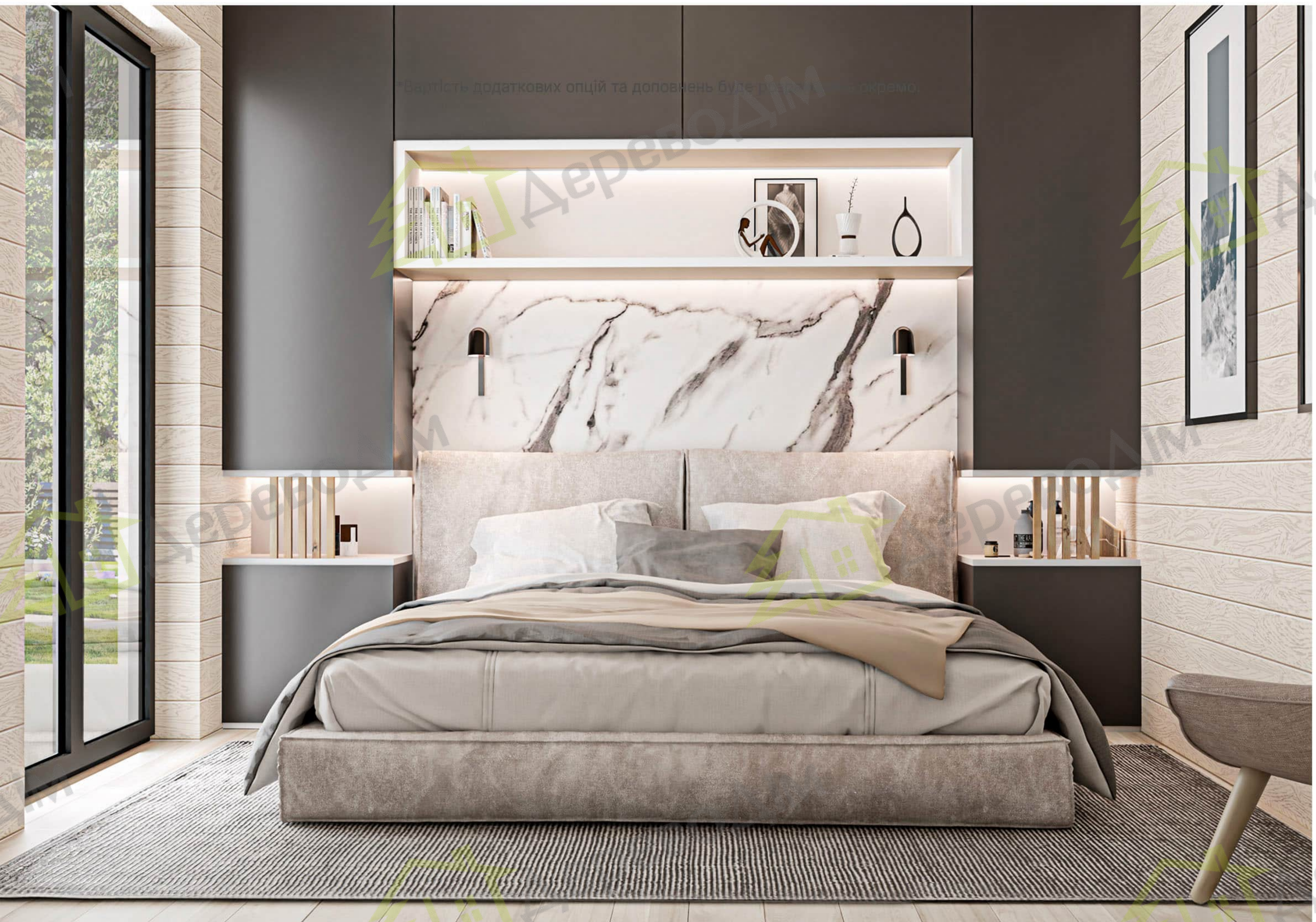
Спальня № 2